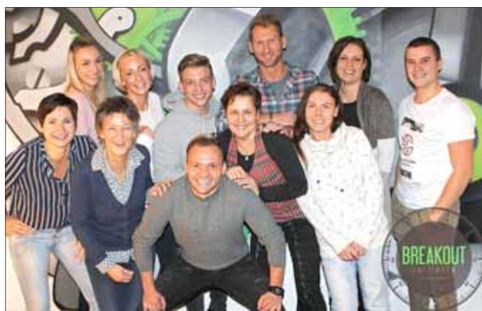
Das FGZ Team im Dezember 2018